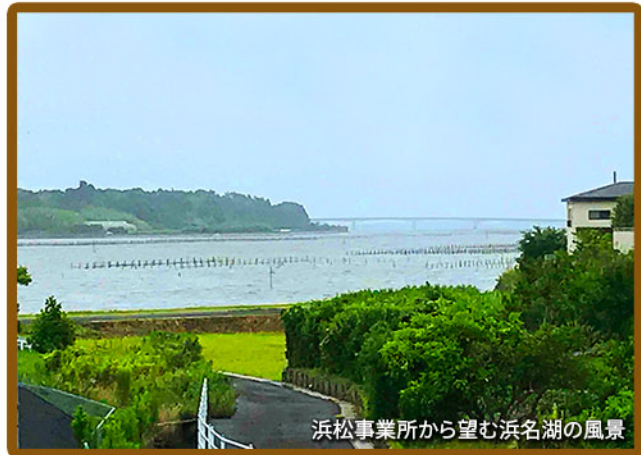
浜松事業所から望む浜名湖の風景

浜松市は、全国でもトップクラスの日照時間と海(遠州灘)・山(浜名湖北岸に連なる湖北連峰や天竜川とその支流の山々、南アルプスの深南部など)・川(天竜川)・湖(浜名湖)が醸し出す豊穡で多彩な町ですが、そんな素晴らしい土地にも負けない程素敵で明るい笑顔を誇る2名の女性スタッフと謹厳実直な3名の歯科技工士が活躍しているのが当社の浜松事業所です。